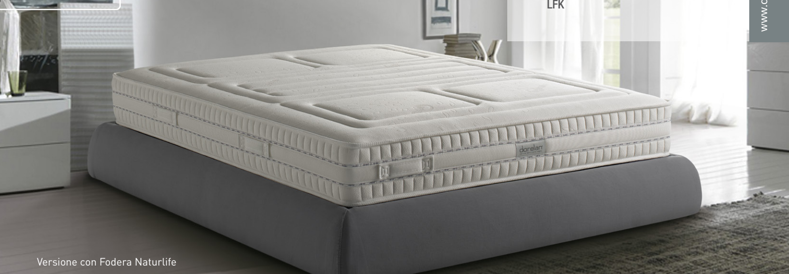
Versione con Fodera Naturlife

Le 700 molle LFK nel cuore di LUX garantiscono a lungo un sostegno solido e deciso , per gli amanti dei materassi più tradizionali. Questo modello Dorelan regala una perfetta risposta elastica ad ogni movimento, senza rinunciare al supporto anatomicamente corretto dall'esclusivo Box System ed al comfort perfettamente equilibrato offerto dal Sistema Fisiomassage .